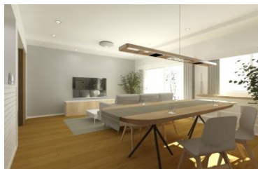
〈VRモデルプランイメージ〉